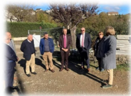
Le chantier du complexe

Le maire, les maires délégués et adjoints présents ont présenté les diverses infrastructures réalisées ces dernières années, ainsi que les travaux en cours et les projets à venir.