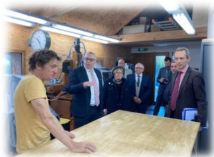
Le Rucher des Tilleuls

Après l'accueil, café avec fougasse (Boulangerie SALVAN) et fougasse praline (Boulangerie L'Épi de la Colagne), Monsieur le Maire a remercié Monsieur le Préfet pour le soutien financier lors des diverses réalisations, mais également pour l'accompagnement de ses services, son écoute et sa disponibilité.