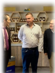
Le Nid des Délices