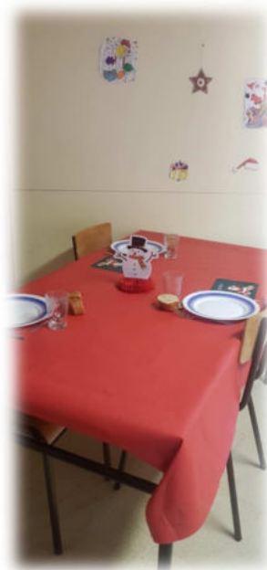
Ecole Marceau Crespin