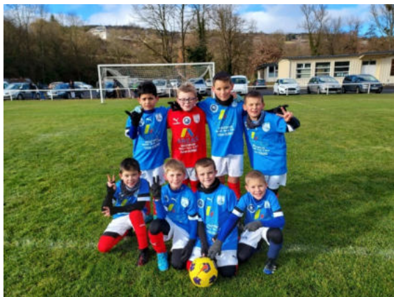
Equipe U10-U11 Entente Marvejols Sports- Chirac Le Monastier

Aujourd'hui, ce sont 20 enfants répartis dans les classes d'âge U7, U9 et U11 qui composent les effectifs. Les U11 sont associés à Marvejols-Sports dans le cadre d'une entente qui fonctionne parfaitement. Ceci est une première réussite.