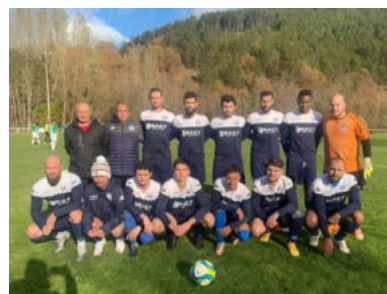
Equipe première - Entente Marvejols Sports- Chirac Le Monastier