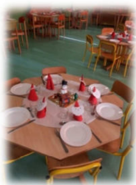
Ecole Claude Érignac

La quasi-totalité des élèves se sont regroupés autour des tables parées de décorations : serviettes pliées en botte ou en couronnes, nappes colorées, traîneaux, skieurs, sapins, bonhommes de neige,... Une ambiance magique dressée par Martine et Bernadette.