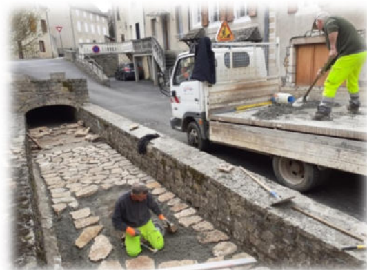
Dallage Quartier du Rieu