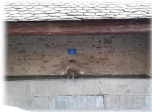
Nettoyage des fontaines