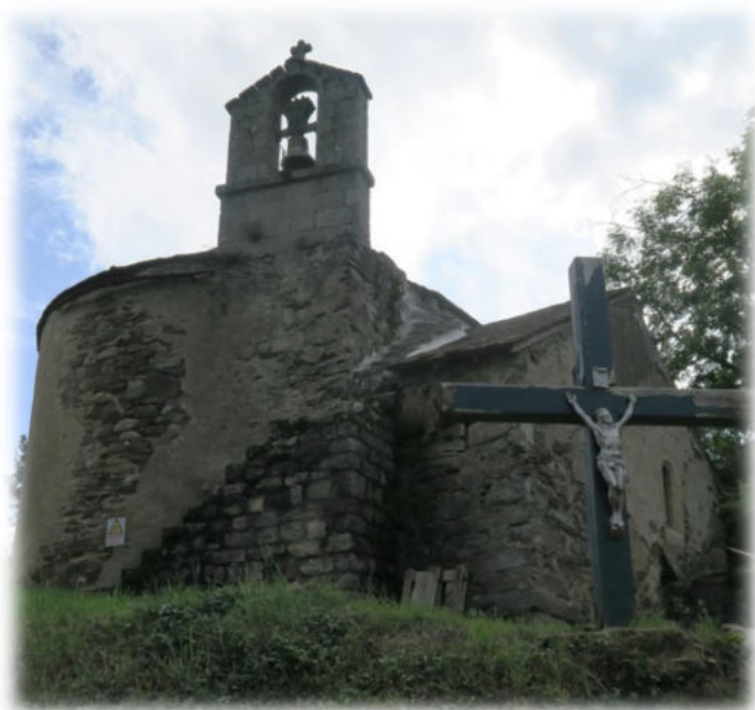
L'église N-D de la Nativité, à Volmanières.