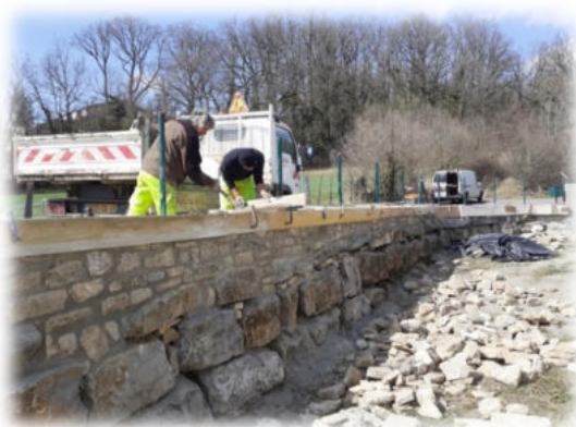
Mur de clôture en pierre