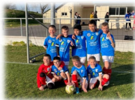
Equipe U10 U11

Par exemple, l'arrosage automatique du terrain d'honneur a pu être réalisé avec un taux de subvention exceptionnel grâce aux efforts conjoints de la mairie et de l'ESCM.