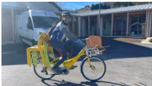
Pas besoin d'un camion pour déplacer une dizaine de chaises!

Une petite trentaine de personnes ont participé au déménagement "bas carbone" de l'école publique Marceau-Crespin ce mercredi 14 février.