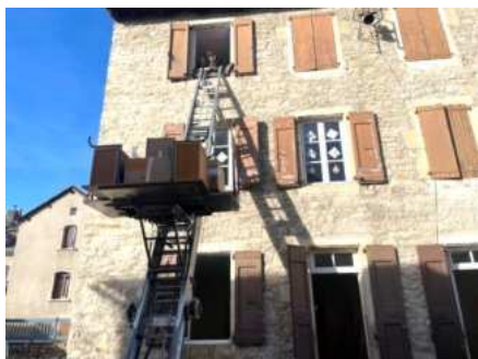
Le mobilier est descendu des salles de classe par une plateforme mobile accrochée à une échelle.

Environ 400 mètres séparent l'ancien bâtiment, situé derrière l'église, des futurs locaux, attenants à la salle des fêtes. La nouvelle école, imaginée par l'atelier d'architecture LCD'O, vient répondre aux normes d'accessibilité et est peu énergivore. Elle a été conçue pour favoriser la transition écologique, enjeu majeur dans notre société. Une volonté de Lionel Bouniol, maire de Bourgs-sur-Colagne, sensible aux questions environnementales. Alors, pour rester dans cet état d'esprit, quoi de mieux que faire un déménagement "bas carbone" ?