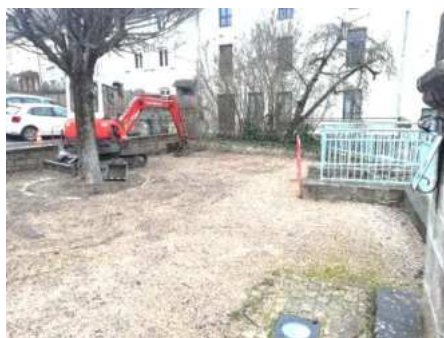
Aménagement paysager de la place de l'Orme