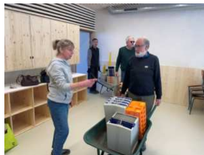
Après le vélo, les colis sont arrivés dans les classes en brouette, avant d'être rangés par les enseignants.