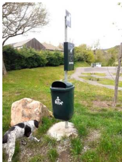
Pose des « TouTouNet » et des râteliers à vélos