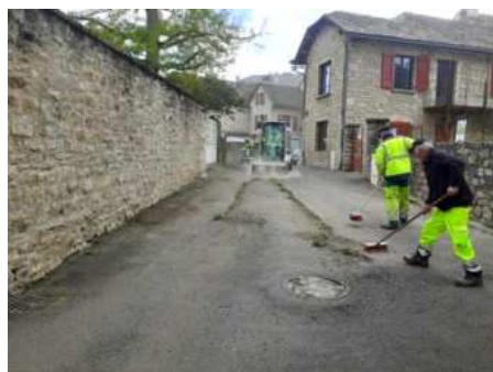
Nettoyage des rues et des ruelles