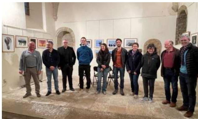
Le vernissage de cette exposition s'est déroulé au musée Saint-Jean en présence des élus de la commune et des photographes invités.

Notre site Internet : https://photoclubchirac.org/