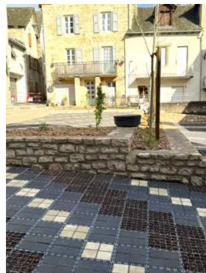
Aménagement de la place de la Tour