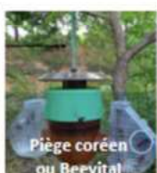
Piège coréen ou Beevital