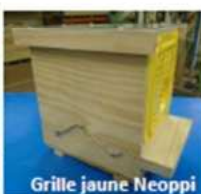
Grille jaune Neoppi