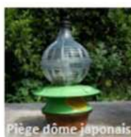
Piège dôme japonais

Seuls les pièges nasse sélectifs sont autorisés, avec une séparation (grille fine) entre l'appât et la partie capture pour éviter la noyade des insectes non cibles. Trou entrée de la nasse Ø = 9mm.