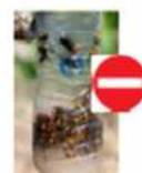
Les pièges bouteilles sont absolument interdits.