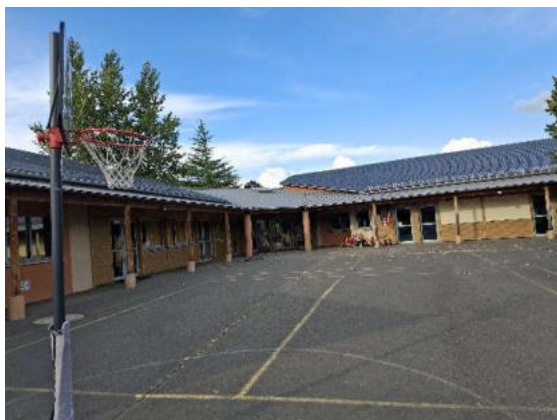
Toiture de l'école Claude ÉRIGNAC