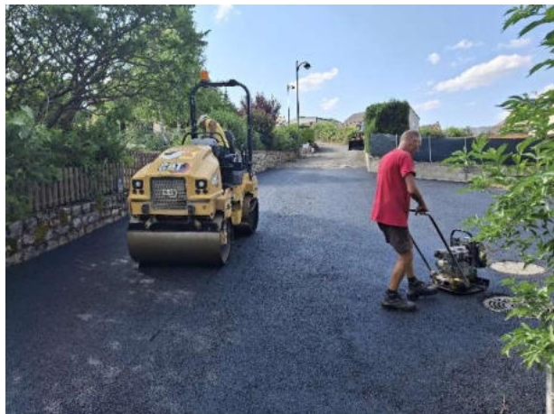
Carrefour rue de la Paurugue et route du Dolmen