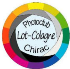
Photo-club Lot Colagne

Ces derniers mois ont été riches en activités pour les membres du Photo Club Lot Colagne.