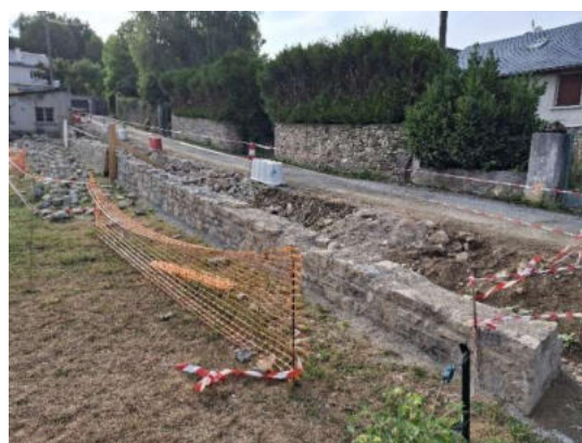
Rue de la Fontaine